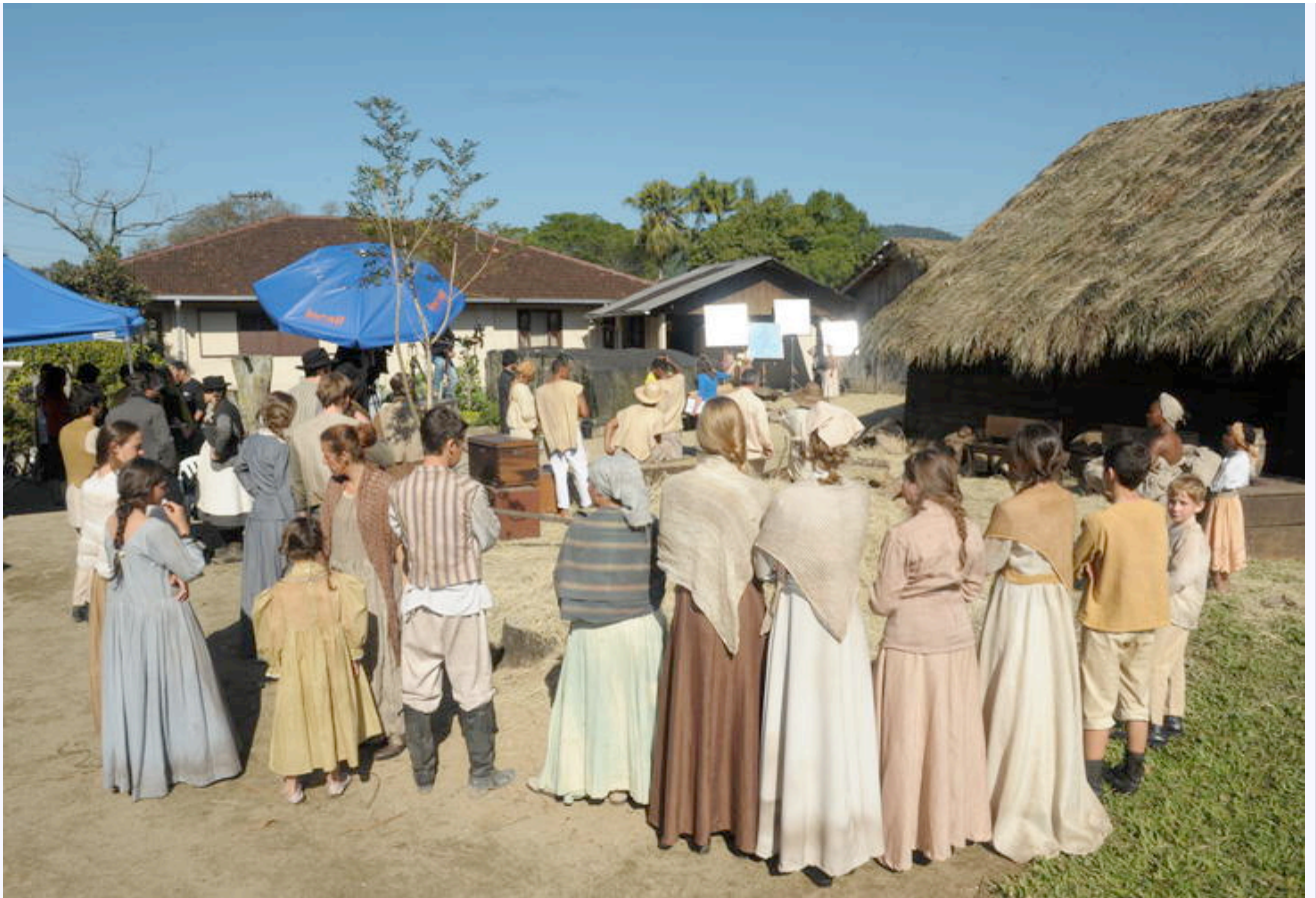
Rio Bonito, na zona rural de Joinville, foi o local escolhido para as filmagens do docudrama