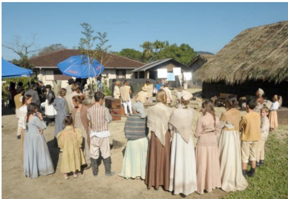
Elenco e equipe técnica em rancho centenário da família Mews, no Rio Bonito, em Joinville – 09/07/2011