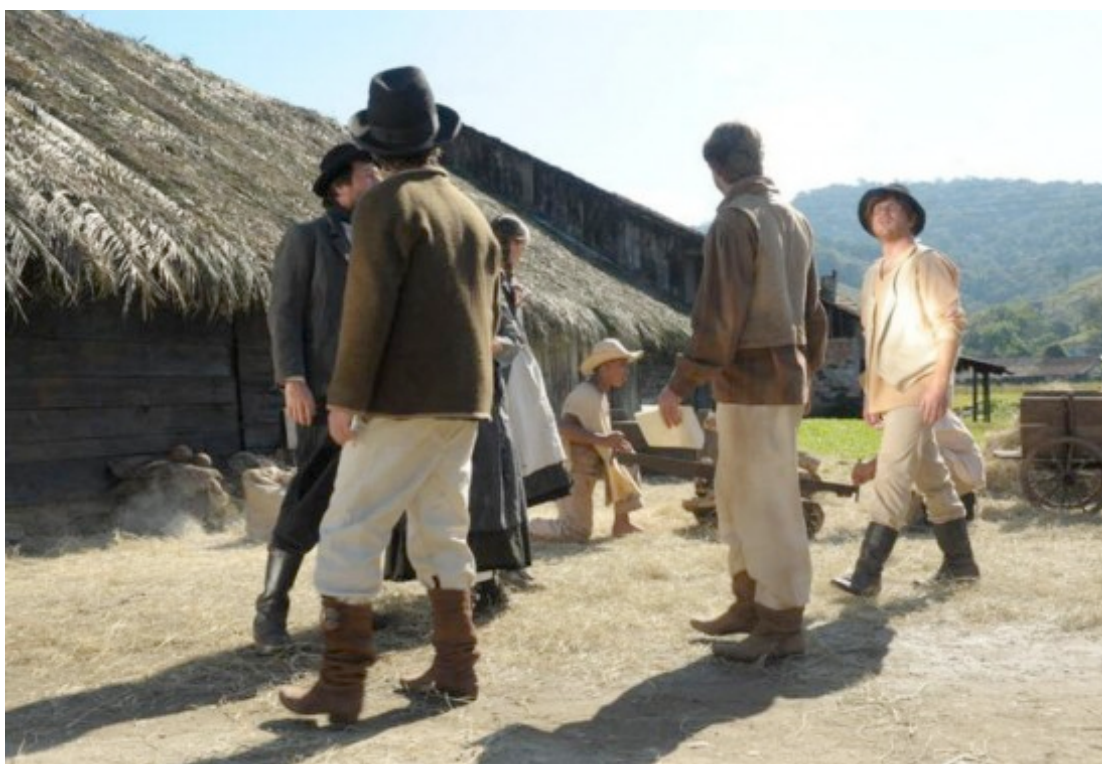
Cena do filme “Suíços Brasileiros – Uma história esquecida” no rancho centenário em Joinville – 09/07/2011