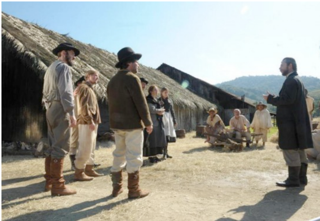
Cena do filme “Suíços Brasileiros – Uma história esquecida” no rancho centenário em Joinville – 09/07/2011

suíços Colombo Stefan, Michelle Cordes e Rhea Micha – que imaginava encontrar uma cidade pronta, quando na verdade se deparam com uma selva a ser desbravada.