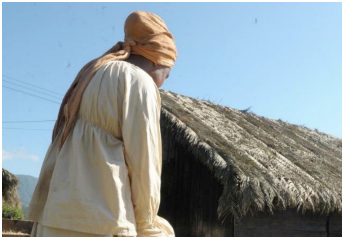
Encontro de culturas no filme “Suíços Brasileiros – Uma história esquecida” – 09/07/2011