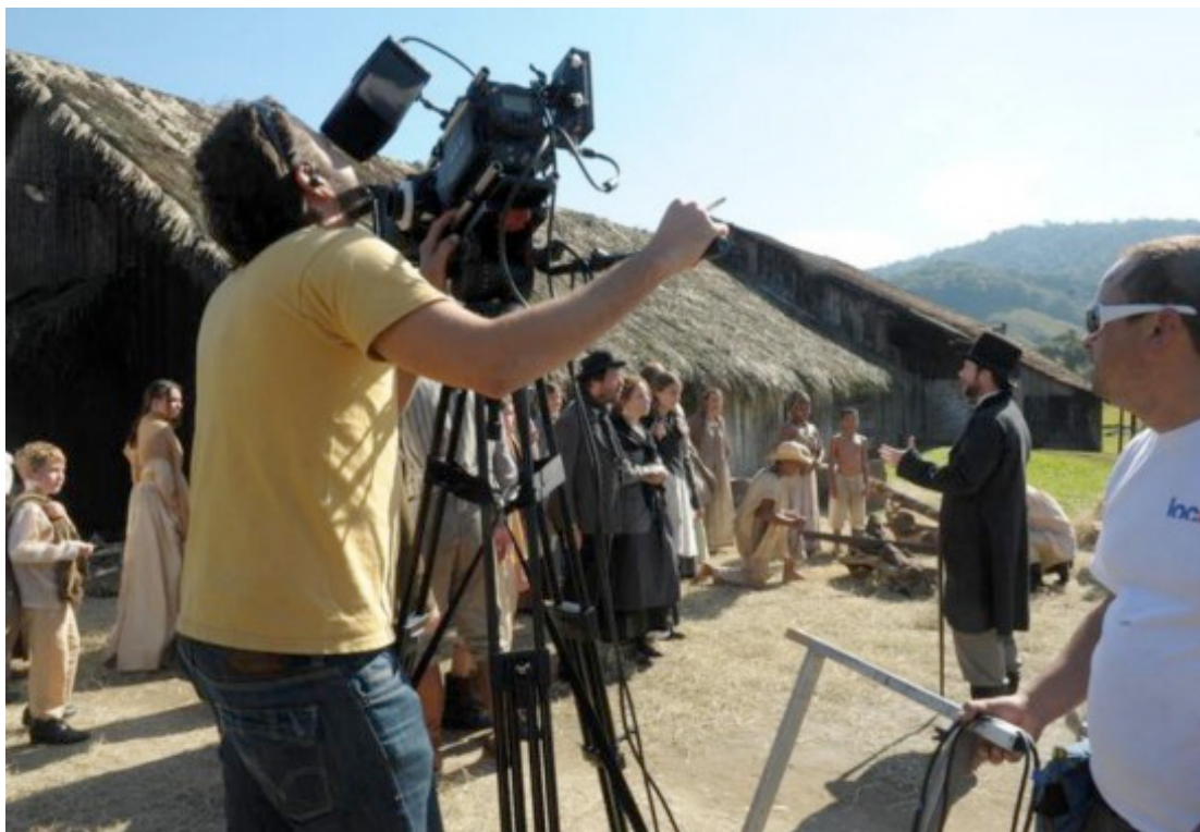
Equipe técnica do filme “Suíços Brasileiros – Uma história esquecida”, no rancho centenário em Joinville – 09/07/2011