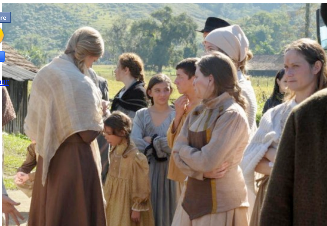
Atores e figurantes do filme “Suíços Brasileiros – Uma história esquecida” – Foto: Salmo Duarte / Agência RBS – 09/07/2011

Abaixo, mais fotos da gravação do filme “Suíços Brasileiros – Uma história esquecida”, no rancho centenário em Joinville: