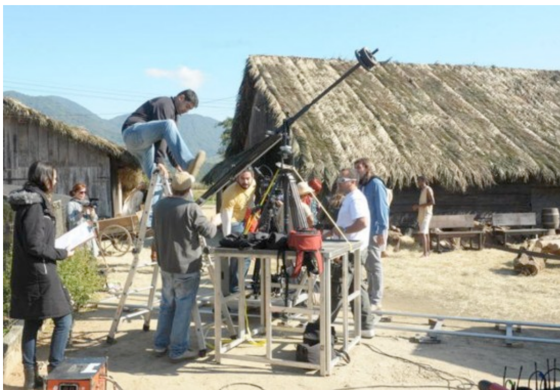
Equipe técnica do filme “Suíços Brasileiros – Uma história esquecida”, no rancho centenário em Joinville